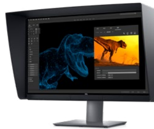
MONITORUL CU PARASOLAR DELL ULTRASHARP 4K PREMIERCOLOR DE 27" | UP2720Q

Senzorul brevetat cu 6 niveluri de utilizare liberă (6DoF) de la 3Dconnexion este creat special să manipuleze conținut digital sau poziții ale camerei în aplicațiile CAD de vârf în domeniu. Împingeți, trageți, răsuciți sau înclinați capacul controlerului 3Dconnexion pentru panoramare, mărire sau micșorare și rotire intuitivă a desenului 3D.