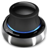
3Dconnexion SPACEMOUSE WIRELESS

Creșteți productivitatea cu o tastatură confortabilă și un mouse care poate funcționa pe aproape orice suprafață (inclusiv sticlă și suprafețe foarte lucioase). Cele două moduri de conectivitate (Bluetooth și receiver USB) vă permit să asociați până la 3 dispozitive.