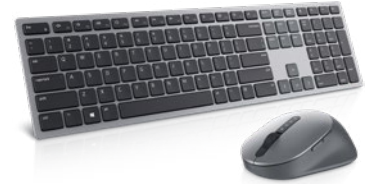
SETUL DE TASTATURĂ ȘI MOUSE WIRELESS DELL PREMIER | KM717

Cea mai puternică stație de andocare de la Dell vă oferă o experiență de productivitate absolută pentru stațiile de lucru mobile din seria 7000. Încărcați sistemul mai rapid, afișați până la trei monitoare 4K, conectați-vă la dispozitivele periferice prin intermediul unui singur cablu cu două conectori USB-C.