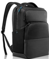
RUCSACUL DELL PRO 17" | PO1720P

Vizualizați imagini realiste cum nu ați mai făcut-o până acum, cu primul monitor 8K de 31,5" premiat din lume, cu Dell PremierColor.