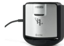
COLORIMETRUL X-RITE I1DISPLAY PRO

*Pe baza analizei interne Dell a testărilor utilizând cablul inclus conectat la PC-uri Dell cu compatibilitate USB 3.1 din a doua generație.