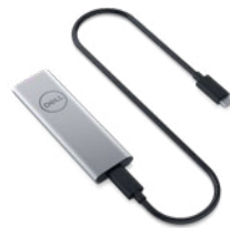
UNITATE SSD PORTABILĂ DELL, 250 GB, USB-C

Protejați-vă notebookul și accesoriile cu acest rucsac lejer realizat din spumă EVA care absoarbe undele de șoc și vopsit cu soluția EcoLoop™ de la Dell.