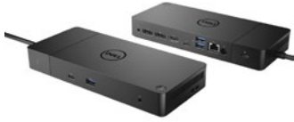
STAȚIA DE ANDOCARE THUNDERBOLT PRECISION | WD19TB

SOLUȚII INTELIGENTE PENTRU A LUCRA MAI EFICIENT.