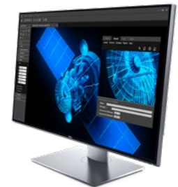
MONITORUL DELL ULTRASHARP 8K DE 32" | UP3218K

*Necesită licență CalMAN, comercializată separat.