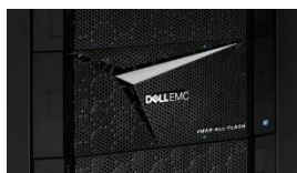
VMAX All Flash

La increíble familia Dell EMC VMAX All Flash ofrece los arreglos VMAX 250F y VMAX 950F. VMAX 950F ofrece un rendimiento y una escalabilidad inigualables como una plataforma de múltiples controladoras de misión crítica y utiliza los procesadores Intel® Xeon® E5-2697-v4 de 18 núcleos que se ejecutan a 2,3 GHz. Con las unidades Enterprise Flash de mayor capacidad, de 7,68 TB y 15,36 TB, y la presentación de dos V-Bricks por gabinete, este nuevo arreglo de clase empresarial ofrece una propuesta de valor convincente diseñada para las cargas de trabajo de almacenamiento más exigentes, que incluye la nueva compatibilidad con los hosts de sistemas abiertos y de mainframe mixtos. Como todos los miembros de la familia todo flash, los datos residen siempre en el nivel más rápido posible (Diamond) para ofrecer el más alto rendimiento de IOPS y la menor latencia. PowerMaxOS con niveles de servicio es una opción atractiva para los clientes de VMAX All Flash.