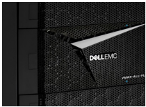
VMAX All Flash

La increíble familia Dell EMC VMAX All Flash ofrece los arreglos VMAX 250F y VMAX 950F. VMAX 950F ofrece un rendimiento y una escalabilidad inigualables como una plataforma de múltiples controladoras de misión crítica y utiliza los procesadores Intel® Xeon® E5-2697-v4 de 18 procesadores principales que se ejecutan a 2,3 GHz. Con los discos Enterprise Flash Drive de mayor capacidad, de 7,68 TB y 15,36 TB, y la presentación de doble V-Brick/gabinete, este nuevo arreglo de clase empresarial ofrece una propuesta de valor convincente diseñada para las cargas de trabajo de almacenamiento más exigentes, que incluya la nueva compatibilidad con los hosts de sistemas abiertos y de mainframe mixtos. Como todos los miembros de la familia All Flash, los datos residen siempre en el nivel más rápido posible (Diamond) para ofrecer el más alto rendimiento de IOPS y la menor latencia. El software PowerMaxOS con niveles de servicio es una opción atractiva para los clientes de VMAX All Flash.