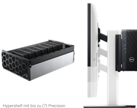
Hypershelf mit bis zu (7) Precision 3280 CFF in einem 5-HE-Rack

Setzen Sie selbst Ihre ambitioniertesten Ideen in die Tat um – mit einer Workstation , die Ihren Kompetenzen entspricht, ohne Ihr Budget zu sprengen. Diese Workstations sind im kompakten, kleinen Formfaktor- und Tower-Design erhältlich und daher ideal für Arbeitsplätze mit begrenztem Platzangebot sowie für einige Edge-Szenarien. Sie eignen sich optimal für Anwendungen in den Bereichen Finanzen, Design, Kreativität und viele mehr.