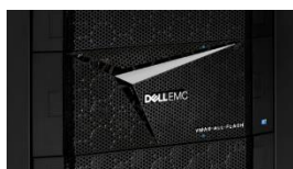
VMAX All Flash

Die attraktive Dell EMC VMAX All Flash-Produktreihe umfasst die VMAX 250F- und VMAX 950F-Arrays. VMAX 950F bietet unvergleichliche Leistung und Skalierbarkeit als geschäftskritische Multi-Controller-Plattform mit Intel® Xeon® E5-2697-v4 18-Kern-Prozessoren mit 2,3 GHz. Dank 7,68- und 15.36-TB-Enterprise-Flash-Laufwerken mit der höchsten Kapazität und Unterbringung von 2 V-Bricks pro Serverschrank bietet dieses neue Array der Enterprise-Klasse ein überzeugendes Nutzenversprechen für die anspruchsvollsten Speicher-Workloads. Erstmals gibt es Unterstützung für gemischte Mainframe- und Open Systems-Hosts. Wie alle Mitglieder der All Flash-Produktreihe befinden sich Ihre Daten immer im schnellstmöglichen Storage-Tier (Diamond), um den höchsten IOPS-Durchsatz und die niedrigstmögliche Latenzzeit zu gewährleisten. PowerMaxOS mit Servicelevels ist eine attraktive Option für VMAX All Flash-Kunden.