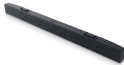
Dell Slim Sound Bar - SB521A

34 吋 WQHD 曲面顯示器具備廣泛的色彩涵蓋範圍和連線能力，包括 RJ45、USB-C® 和快速存取正面連接埠，讓您享有身歷其境的感受。