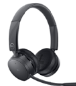
Dell Pro 無線耳機 - WL5022

這款高品質的 4K 網路攝影機，透過大型 4K Sony STARVIS™ CMOS 感應器和人工智慧自動構圖功能，將您的視覺效果最佳化，提升您的視訊會議體驗。