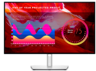
Dell UltraSharp 27 顯示器 - U2722D

全球最纖薄輕巧的 Sound Bar，為您的 Dell 顯示器提供優異的音訊清晰度，磁吸式設計可輕鬆貼合於顯示器，確保桌面井然有序。