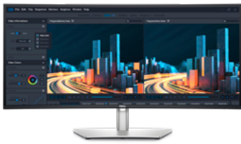
Dell UltraSharp 34 USB-C 集線器曲面顯示器 - U3421WE

34 吋 WQHD 曲面顯示器具備廣泛的色彩涵蓋範圍和連線能力，包括 RJ45、USB-C® 和快速存取正面連接埠，讓您享有身歷其境的感受。