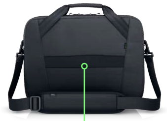
行李箱套帶讓您在機場和火車站輕鬆移動