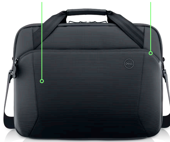
專為科技配件打造的收納袋