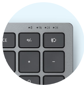
電池和連線能力指示燈