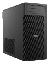
A Dell Pro Max 立式 T2

Dell Pro Max 高效能電腦可驅動最密集的工作負載。桌上型電腦與筆記型電腦均可立即處理具備 VR/AR 與 AI 功能且極度耗電的應用程式。無論是需要隨附掛接套件和顯示器並可完全展開的桌上型電腦，或是彈性的模組化設計，Dell Pro Max 提供符合學校需求的多種選擇。