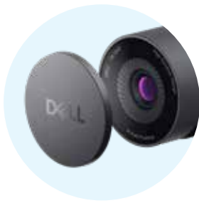
磁吸式快门盖 方便保管，保护镜头