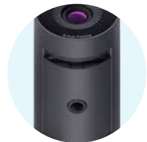
卓越的视频质量 2K QHD 可实现更清晰锐利的图像