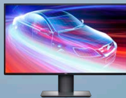
戴尔 ULTRASHARP 27 系列 4K USB-C 显示器 — U2720Q

这款紧凑型键盘鼠标套装可在 3 台 PC 之间实现无缝切换，让桌面整洁有序，而长达 36 个月 6 的电池续航时间可助您保持高效工作。