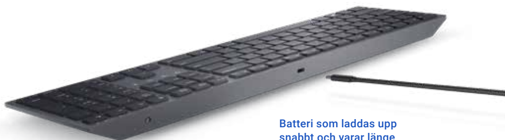
Batteri som laddas upp snabbt och varar länge