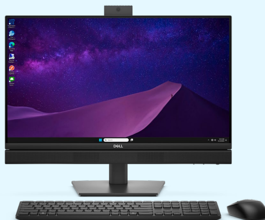
Dell Pro 24 all in one de 35 W (QC24251)

Recursos essenciais de desempenho em um notebook confiável e otimizado para produtividade.