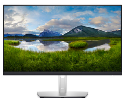
Dell 24 USB-C-hubmonitor - P2422HE

Altijd productief, ongeacht waar u werkt. Verminder schadelijk blauw licht met deze stijlvolle 23,8-inch FHD-hubmonitor met ComfortView Plus.