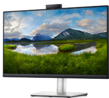
Dell 24 monitor voor videoconferencing - C2423H

Blijf synchron op een 24-inch FHD-monitor met geïntegreerde conferentiebehoeften, weinig blauw licht en een milieuvriendelijk ontwerp.