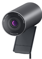
Dell professionele webcam - WB5023

Altijd productief, ongeacht waar u werkt. Verminder schadelijk blauw licht met deze stijlvolle 23,8-inch FHD-hubmonitor met ComfortView Plus.