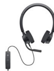
Dell bekabelde/draadloze headset - WH3022

Werk efficiënt. Eenvoudige dual mode connectiviteit biedt u de mogelijkheid om te koppelen en verbinding te maken met vrijwel elke pc via 2,4 GHz draadloos of Bluetooth 5.0.