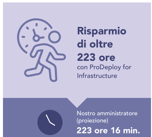
Figura 4: Tempo estrapolato, in ore e minuti, e passaggi necessari per implementare 100 server PowerEdge. Valori più bassi indicano risultati migliori.