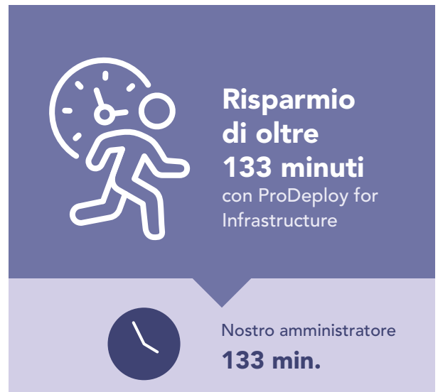
Figura 3: Tempo (in minuti) e passaggi necessari per implementare un singolo server PowerEdge. Valori più bassi indicano risultati migliori.

ProDeploy può anche aiutare a gestire rollout di server di grandi dimensioni o in più fasi implementando i server per voi. Per dimostrare quanto tempo un'organizzazione potrebbe risparmiare utilizzando ProDeploy for Infrastructure in un'installazione di server su larga scala, abbiamo estrapolato i tempi rilevati per l'implementazione di un singolo server Dell PowerEdge R750 su 100 server. Come mostra la Figura 4, consentire a un tecnico certificato da Dell di implementare 100 server PowerEdge potrebbe farvi risparmiare oltre 223 ore rispetto all'implementazione da parte di un amministratore interno.