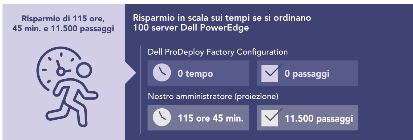
Figura 2: Tempo di amministrazione interna estrapolato, in ore e minuti, e passaggi necessari per configurare 100 server PowerEdge. Valori più bassi indicano risultati migliori.

Le organizzazioni di livello enterprise sostituiscono spesso grandi quantità di server e talvolta devono fornire a più sedi molti server configurati in modo coerente. Il nostro primo scenario di test riflette questi casi d'uso e dimostra probabilmente un valore maggiore conseguente all'uso di ProDeploy Factory Configuration. Per dimostrare quanto tempo un'organizzazione potrebbe risparmiare utilizzando ProDeploy Factory Configuration su un'installazione di server su larga scala, abbiamo estrapolato i tempi rilevati dalla configurazione di un singolo server PowerEdge R750 a 100 server. Come mostra la Figura 2, consentendo al servizio di completare tutte le attività di configurazione per 100 server (invece di farle completare manualmente a un amministratore) si potrebbero risparmiare circa 115 ore, garantendo al contempo che la configurazione rimanga coerente per ogni server durante l'intera installazione.