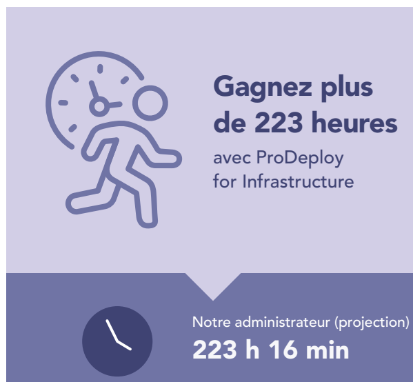
Figure 4 : Temps extrapolé, en heures et minutes, et étapes pour déployer 100 serveurs PowerEdge. Moins c’est mieux.