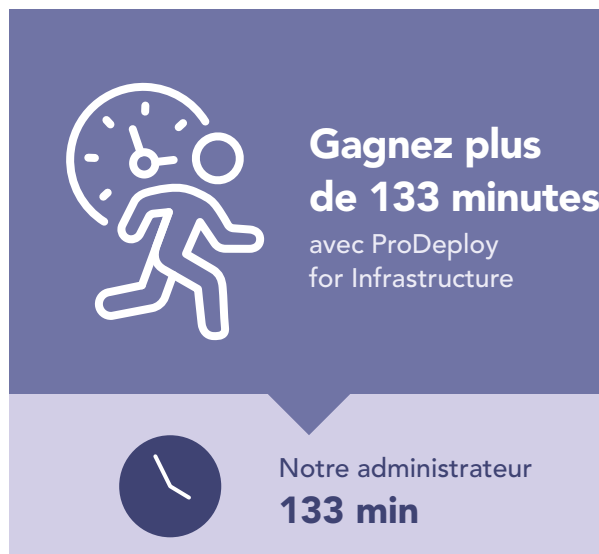
Figure 3 : Temps, en minutes, et étapes pour déployer un serveur PowerEdge unique. Moins c’est mieux.

ProDeploy peut également vous aider dans le cadre d’un déploiement de serveurs volumineux ou multiphases, en déployant les serveurs pour vous. Pour montrer combien de temps une entreprise pourrait gagner en utilisant ProDeploy for Infrastructure sur une installation de serveur à grande échelle, nous avons extrapolé à 100 serveurs les minutages capturés lors du déploiement d’un serveur Dell PowerEdge R750 unique. Comme le montre la figure 4, laisser un ingénieur agréé Dell déployer 100 serveurs PowerEdge pour vous pourrait vous faire gagner plus de 223 heures par rapport à demander à un administrateur interne de les déployer.