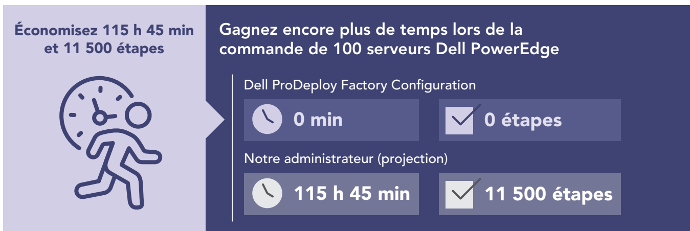
Figure 2 : Temps d'administration interne extrapolé, en heures et minutes, et étapes pour configurer 100 serveurs PowerEdge. Moins c'est mieux.

Les grandes entreprises remplacent souvent de grandes quantités de serveurs et doivent parfois fournir de nombreux serveurs configurés de manière cohérente à plusieurs emplacements. Notre premier scénario de test reflète ces cas d'utilisation et démontre peut-être une plus grande valeur de l'utilisation de ProDeploy Factory Configuration. Pour montrer combien de temps une entreprise pourrait gagner en utilisant ProDeploy Factory Configuration sur une installation de serveur à grande échelle, nous avons extrapolé à 100 serveurs les minutages capturés à partir de la configuration d'un serveur PowerEdge R750 unique. Comme le montre la figure 2, laisser le service effectuer toutes les tâches de configuration pour 100 serveurs (plutôt que de demander à un administrateur de les effectuer manuellement) pourrait permettre d'économiser environ 115 heures, tout en garantissant que la configuration reste cohérente pour chaque serveur tout au long de l'installation.