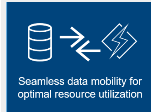
Transferencia de datos