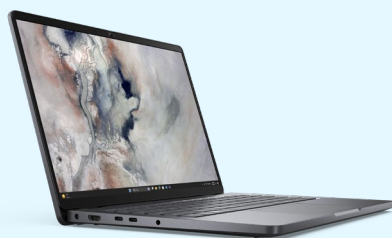
Dell Pro 14 (PC14250)

Funciones de rendimiento esenciales en un portátil fiable optimizado para la productividad.