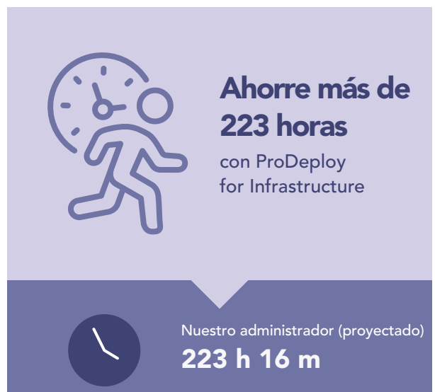
Figura 4: Extrapolación del tiempo, en horas y minutos, y pasos para implementar 100 servidores PowerEdge. Cuanto menor, mejor.