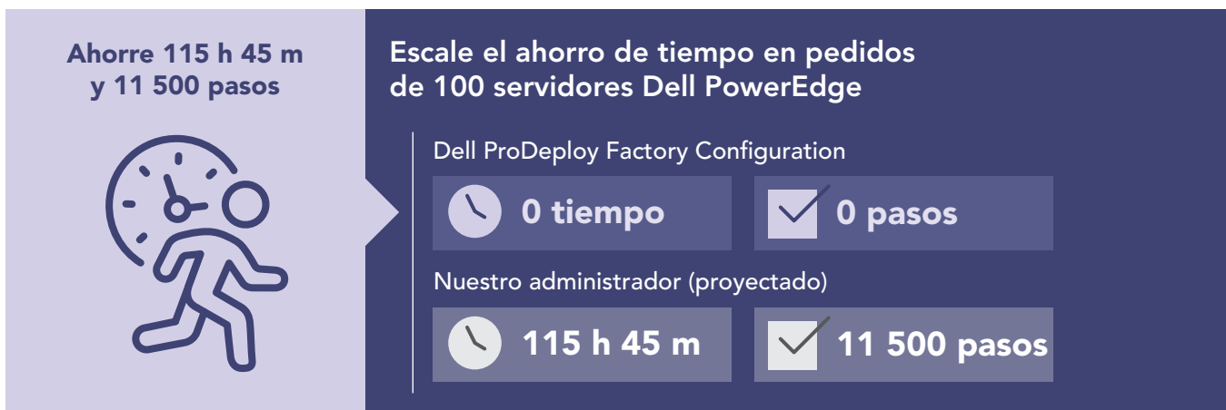
Figura 2: Extrapolación del tiempo del administrador interno, en horas y minutos, y pasos para configurar 100 servidores PowerEdge. Cuanto menor, mejor. Fuente: Principled Technologies.

Las organizaciones de ámbito empresarial suelen reemplazar grandes cantidades de servidores y, en ocasiones, tienen que suministrar un gran número de servidores configurados de forma homogénea a múltiples ubicaciones. Nuestro primer escenario de prueba refleja estos casos de uso y demuestra posiblemente un mayor valor del uso de ProDeploy Factory Configuration. Para mostrar cuánto tiempo podría ahorrar una organización utilizando ProDeploy Factory Configuration en una instalación de servidores a gran escala, extrapolamos los tiempos que registramos de la configuración de un único servidor PowerEdge R750 a 100 servidores. Como muestra la Figura 2, permitir que el servicio complete todas las tareas de configuración para 100 servidores (en lugar de que un administrador las complete manualmente) podría ahorrar aproximadamente 115 horas, al tiempo que se garantiza que la configuración se mantiene homogénea en todos los servidores a lo largo de la instalación.