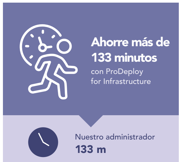
Figura 3: Tiempo, en minutos, y pasos para implementar un único servidor PowerEdge. Cuanto menor, mejor.

ProDeploy también puede ayudarle con un despliegue de servidores grande o en varias fases, implementando los servidores por usted. Para mostrar cuánto tiempo podría ahorrar una organización utilizando ProDeploy for Infrastructure en una instalación de servidores a gran escala, extrapolamos los tiempos registrados de la implementación de un único servidor Dell PowerEdge R750 a 100 servidores. Tal como muestra la Figura 4, confiar a un técnico certificado por Dell la implementación de 100 servidores PowerEdge podría ahorrar más de 223 horas en comparación con la implementación realizada por un administrador interno.