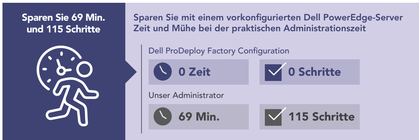
Abbildung 1: Interne Administrationszeit (in Minuten) und Schritte zur Konfiguration eines einzelnen PowerEdge-Servers. Weniger ist besser.

Abbildung 1 zeigt die Gesamtzeit und die Schritte zur Durchführung der Konfigurationsaufgaben nach dem Zurücksetzen des PowerEdge-Servers. Die vollständige Liste der Aufgaben finden Sie im wissenschaftlichen Hintergrund dieses Berichts . Bitte beachten Sie, dass die Zeitersparnis durch die Verwendung von Bereitstellungstools bei der Konfiguration von Servern vor Ort variieren kann.