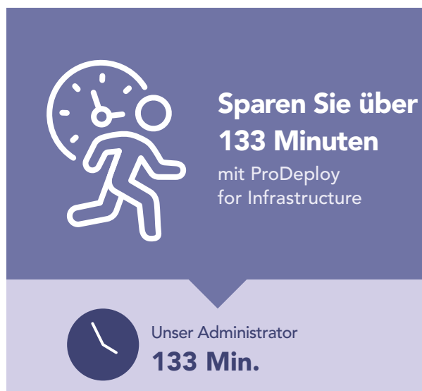
Abbildung 3: Zeit (in Minuten) und Schritte für die Bereitstellung eines einzelnen PowerEdge-Servers. Weniger ist besser.

ProDeploy kann auch bei einer großen oder mehrstufigen Servereinführung helfen, indem es die Server für Sie bereitstellt. Um zu zeigen, wie viel Zeit ein Unternehmen durch den Einsatz von ProDeploy for Infrastructure bei einer groß angelegten Serverinstallation einsparen kann, haben wir die erfassten Zeiten für die Bereitstellung eines einzelnen Dell PowerEdge R750-Servers auf 100 Server hochgerechnet. Wie Abbildung 4 zeigt, können Sie durch die Bereitstellung von 100 PowerEdge-Servern durch einen von Dell zertifizierten Techniker mehr als 223 Stunden einsparen, als wenn Sie die Server von einem internen Administrator bereitstellen lassen.