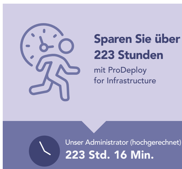
Abbildung 4: Hochgerechnete Zeit, in Stunden und Minuten, und Schritte zur Bereitstellung von 100 PowerEdge-Servern. Weniger ist besser.