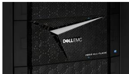
VMAX All Flash

Inline-Komprimierung wird ab der Version HYPERMAX 5977 vom Q3 2016 von der gesamten VMAX All Flash-Produktreihe unterstützt. Jeder Director konsolidiert Front-End-, globalen Arbeitsspeicher- und Back-End-Funktionen und ermöglicht so den direkten Speicherzugriff auf Daten für optimierte E/A-Vorgänge. Je nach gewähltem Array können bis zu acht (8) VMAX All Flash V-Bricks unterstützt werden, um hochgradig skalierbare Leistung und hohe Verfügbarkeit zu gewährleisten. Weitere Spezifikationen und ein Vergleich der VMAX 250F- und 950F-Arrays folgen weiter unten.